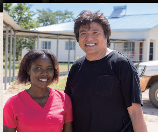
スーダン・ザンビアで「医」を届ける活動をする